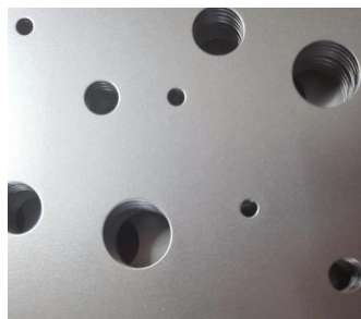
→Tôle R8 T12